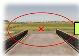
三叉路正面「キケン」