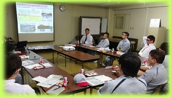
11月15日 デンソー幸田工場で