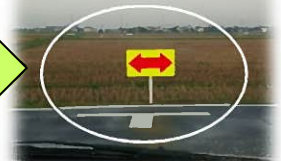
路面標示と標識設置