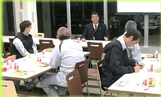
11月10日 デンソー西尾工場で

在住者の皆さんの「生の声」を聴く、ふれあいトークを11月に4度開催。 年齢や在住地域から、さまざまな「声」を聴くことができました。 皆さんの「声」を今後の議員活動に反映していきます。