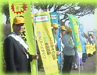
「安全なまちづくり運動」

過去3年3か月ゼロを続けてきた幸田町での死亡事故が、10.11月に2件発生しました。