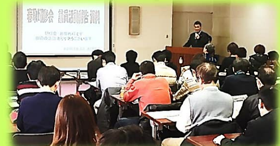
春の取り組み研修会（12月19日） いなべ市民会館（いなべ市）