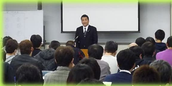
組合新任役員研修会（11月19日） 産業振興センター（刈谷市）